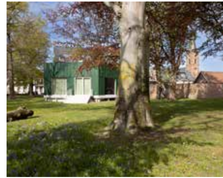
Het achterliggende park groeide uit tot een dorpspark met wandelpaden en zitplekken.