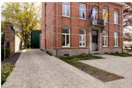
Ook het voorplein werd heraangelegd, zodat het samen met het stationsplein één leesbaar geheel vormt.