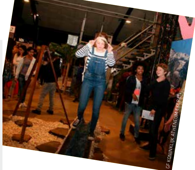
OF KONINKLIJK ATHENEUM EKEREN

Jongeren bewust maken van de mondiale samenleving waarin zij leven, ook dat is bijdragen aan SDG 4. De Wereldmeerdaagse dompelt leerlingen en leerkrachten van de eerste graad secundair een halve schooldag lang onder in een mondiaal bad met een wereldfilm en een interactieve 'wereldmarkt' met veertig doe-stands. Ngo's en vierdepijlerorganisaties verzorgen de interactieve standen, vrijwilligers begeleiden de leerlingen bij korte opdrachtjes. Meer dan 11.000 jongeren van bijna zestig scholen ontdekken zo jaarlijks wat de problemen en de kansen van de wereld vandaag zijn, maar ook hoe we aan oplossingen voor globale uitdagingen kunnen werken. Voor de voorbereiding en naverwerking in de klas is er een uitgebreid educatief pakket met dossiers, video's en lesmappen. De editie van 2019 werd uitgewerkt door Vzw Mundio samen met de Antwerpse provinciale dienst Mondiaal Beleid. De gemeente Brasschaat en de stad Mechelen waren gastgemeenten.