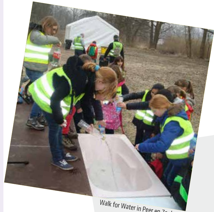
Walk for Water in Peer en Zonhoven