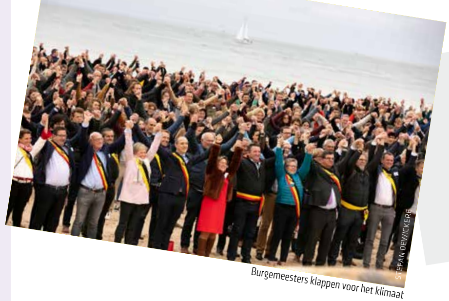
Burgemeesters klappen voor het klimaat