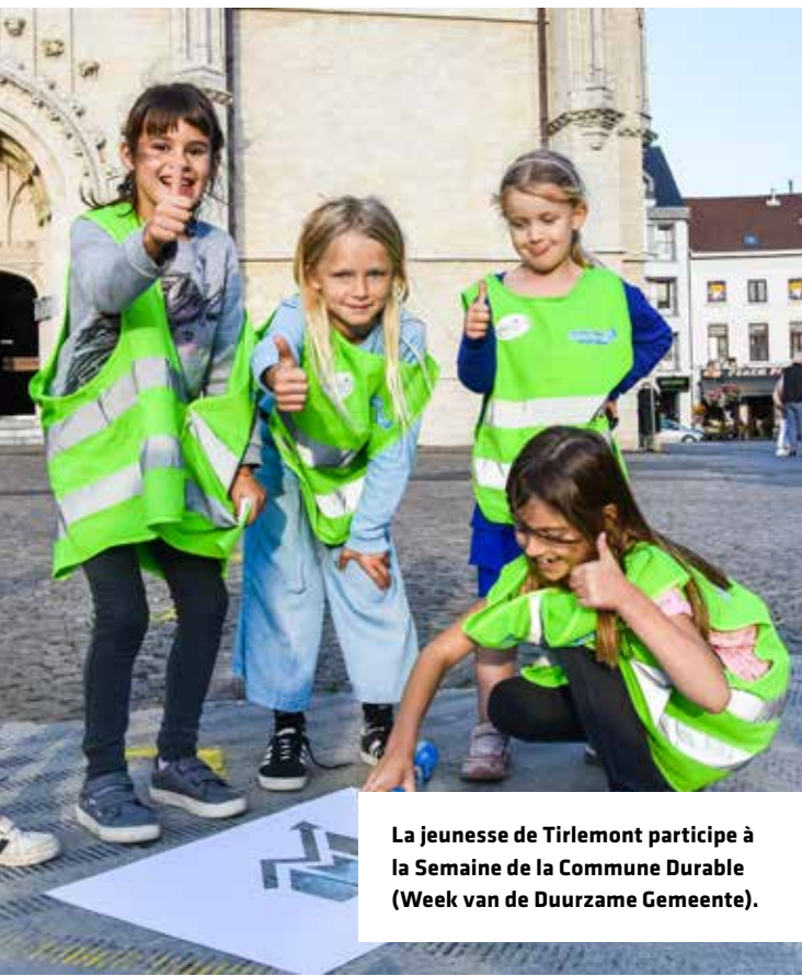
La jeunesse de Tirlemont participe à la Semaine de la Commune Durable (Week van de Duurzame Gemeente).

Conseil communal des enfants Diverses communes flamandes disposent d'un conseil communal des enfants. Le conseil communal des enfants (composé par exemple de deux enfants de chaque école du territoire communal) se rassemble plusieurs fois par an afin de discuter de sujets importants aux yeux des enfants à ce moment. Il peut s'agir de thématiques telles que « les jeux en temps libre », « la pauvreté » et « la sécurité routière ». Mettez en place un conseil communal des enfants similaire dans la commune partenaire. Nommez les enfants participants comme ambassadeurs du partenariat international communal, des ODD et de la solidarité internationale. Par le biais d'une campagne ou d'un jeu, rendez visibles les thématiques abordées, les ODD et les propositions des conseils communaux des enfants dans les deux communes.