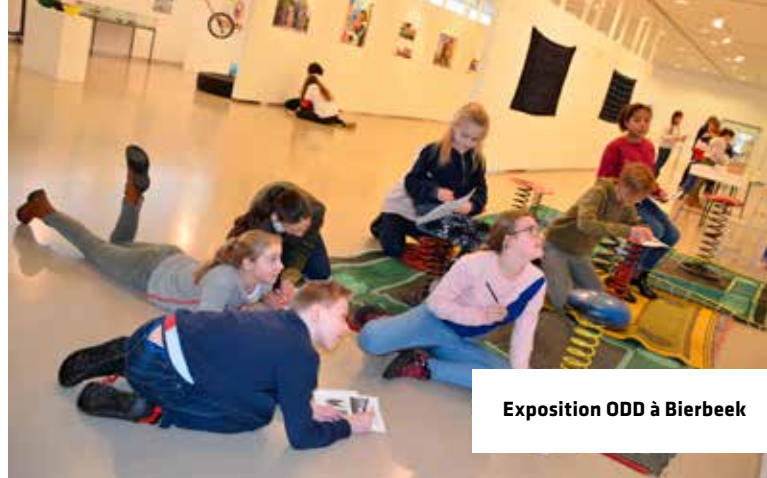
Exposition ODD à Bierbeek