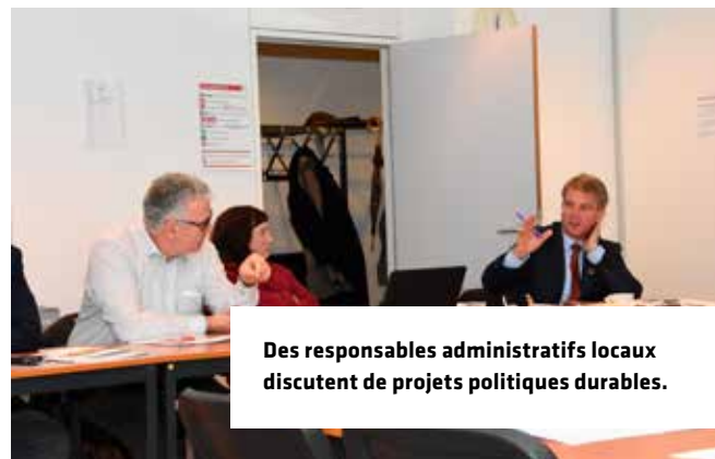
Des responsables administratifs locaux discutent de projets politiques durables.

Laissez votre partenaire international communal proposer et mettre au point un projet politique pour votre commune, et faites-en de même pour votre administration partenaire. Au sein de chaque commune, un groupe de personnes réfléchit à propos d'un projet pouvant être réalisé dans l'autre commune, en partant par exemple de l'inventaire relatif aux ODD susmentionné.