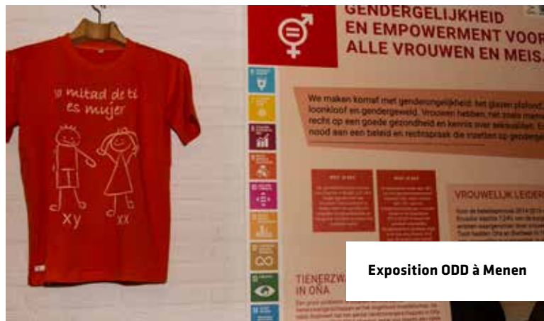
Exposition ODD à Menen