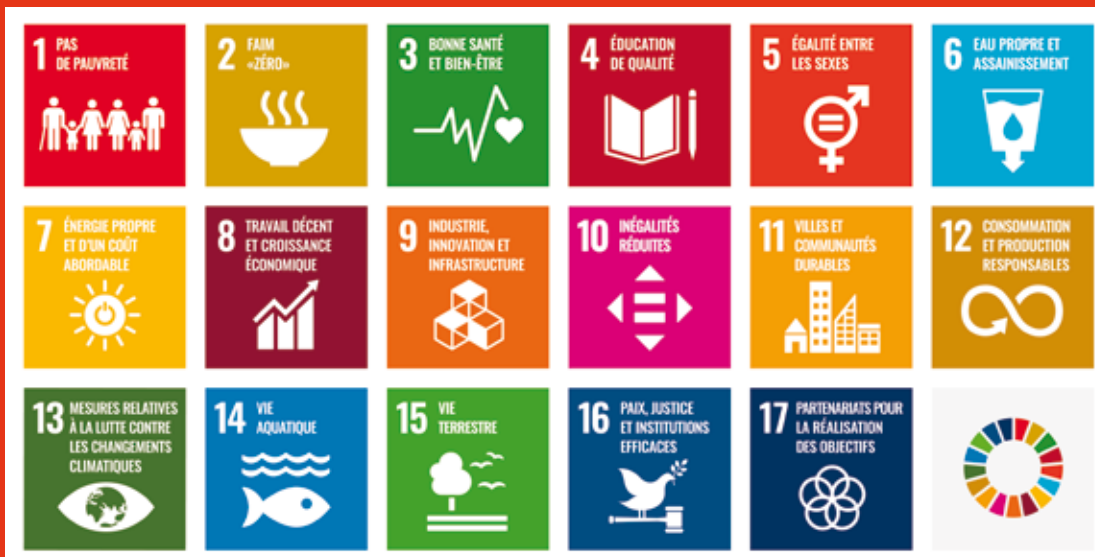
Image de couverture – Les ODD sont découverts de manière interactive lors de l'échange de jeunes dans le cadre du partenariat international communal entre Sint-Truiden et Nueva Guinea (Nicaragua).