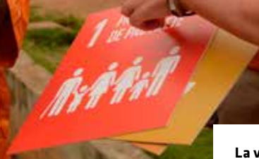
La ville d'Hoogstraten en mission au Bénin.