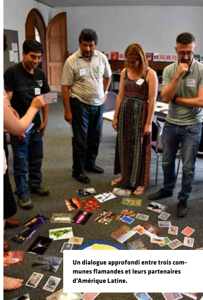
Un dialogue approfondi entre trois communes flamandes et leurs partenaires d'Amérique Latine.

Intégrez les ODD dans l'accord de collaboration et le programme pluriannuel stratégique avec la commune partenaire. Veillez (au minimum) à ce que les ODD soient explicitement mentionnés dans l'accord de collaboration avec le partenaire international communal et attribuez aux ODD un rôle à part entière en tant que cadre directeur de la collaboration internationale. Dans l'idéal, vous devriez aller un peu plus loin et établir le programme pluriannuel abordant les 17 ODD (ou les 169 cibles liées aux ODD) comme une approche délibérée pour tous les objectifs et/ou plans d'action stratégiques. Vous pouvez également choisir d'effectuer une analyse de matérialité ou d'impact (en néerlandais) au début du processus, afin d'identifier les ODD sur lesquels votre partenariat peut avoir le plus gros impact ou faire le plus de progrès. Ces ODD « prioritaires » peuvent ensuite être utilisés comme pierre angulaire de toutes les nouvelles activités dans le programme pluriannuel. Finalement, veillez à ce que le programme soit rédigé avec les Maires, échevins, fonctionnaires et acteurs de la société civile, et ce après qu'un échange ait eu lieu entre les différents groupes des deux communes autour des (sous-)objectifs des Nations Unies.