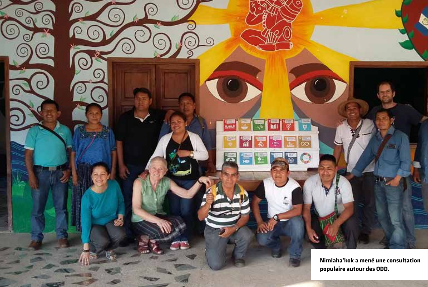
Nimlaha'kok a mené une consultation populaire autour des ODD.