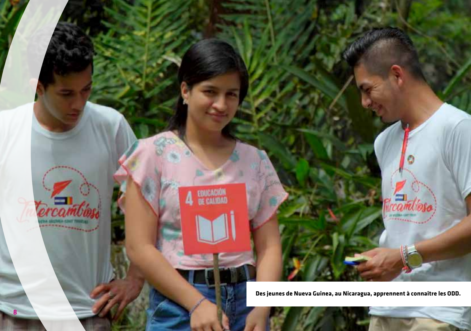
Des jeunes de Nueva Guinea, au Nicaragua, apprennent à connaître les ODD.