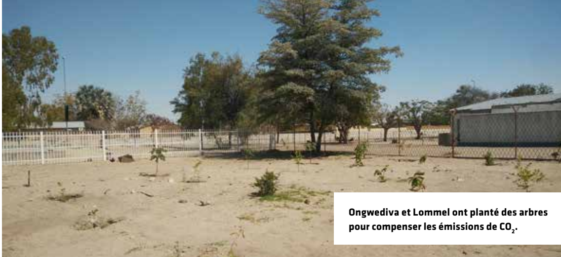
Ongwediva et Lommel ont planté des arbres pour compenser les émissions de CO 2 .

Donnez le bon exemple, en tant que commune. La puissance d'un partenariat international communal est réduite de moitié sans mission d'échange. Les transports aériens entre les deux communes partenaires sont donc bien souvent inévitables, mais il faut néanmoins essayer de tenir compte de son impact sur le climat. Concentrez-vous sur l'ODD 13 (climat) en compensant les émissions de CO 2 de vos vols. Cela est faisable en plantant vous-même des arbres de votre commune (partenaire) – cela fera également de votre commune (partenaire) un lieu de vie plus agréable – ou frappez à la porte d'un organisme agréé qui convertit vos émissions de CO 2 en initiatives écologiques (pensez par exemple à Bos+ ou greentripper.org). Il y a deux ans, dans le cadre de l'échange de jeunes entre Ongwediva et Lommel, il a été décidé de planter 15 arbres en compensation, un par participant : 10 à Lommel, 5 à Ongwediva.