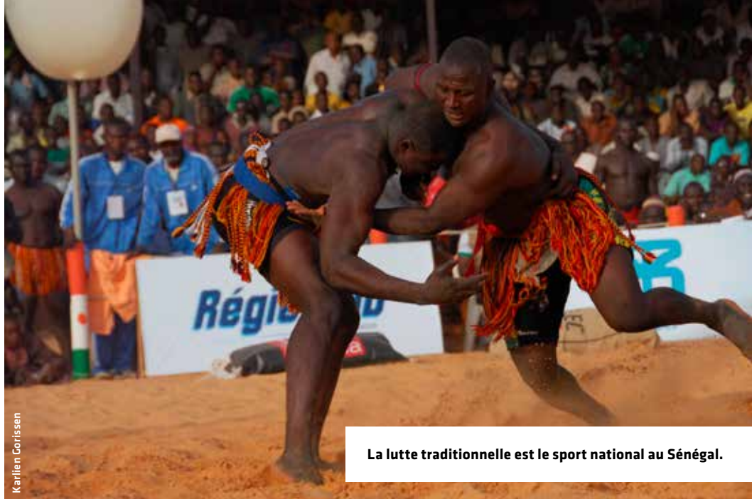
La lutte traditionnelle est le sport national au Sénégal.

Jeux olympiques des ODD Inventez une activité sportive autour de chacun des 5 piliers de développement durable (People, Planet, Prosperity, Peace, Partnership). Par exemple, pour le pilier People, vous pouvez essayer d'organiser une session de yoga avec le plus de personnes possible. Pour le pilier Planet, réaliser un « plogging » avec le plus de randonneurs/ coureurs possible (ramasser autant de déchets que possible durant la randonnée/le jogging). Vous pouvez essayer d'atteindre ensemble un objectif précis dans les différentes communes ou mettre en place une compétition entre les collectivités partenaires.