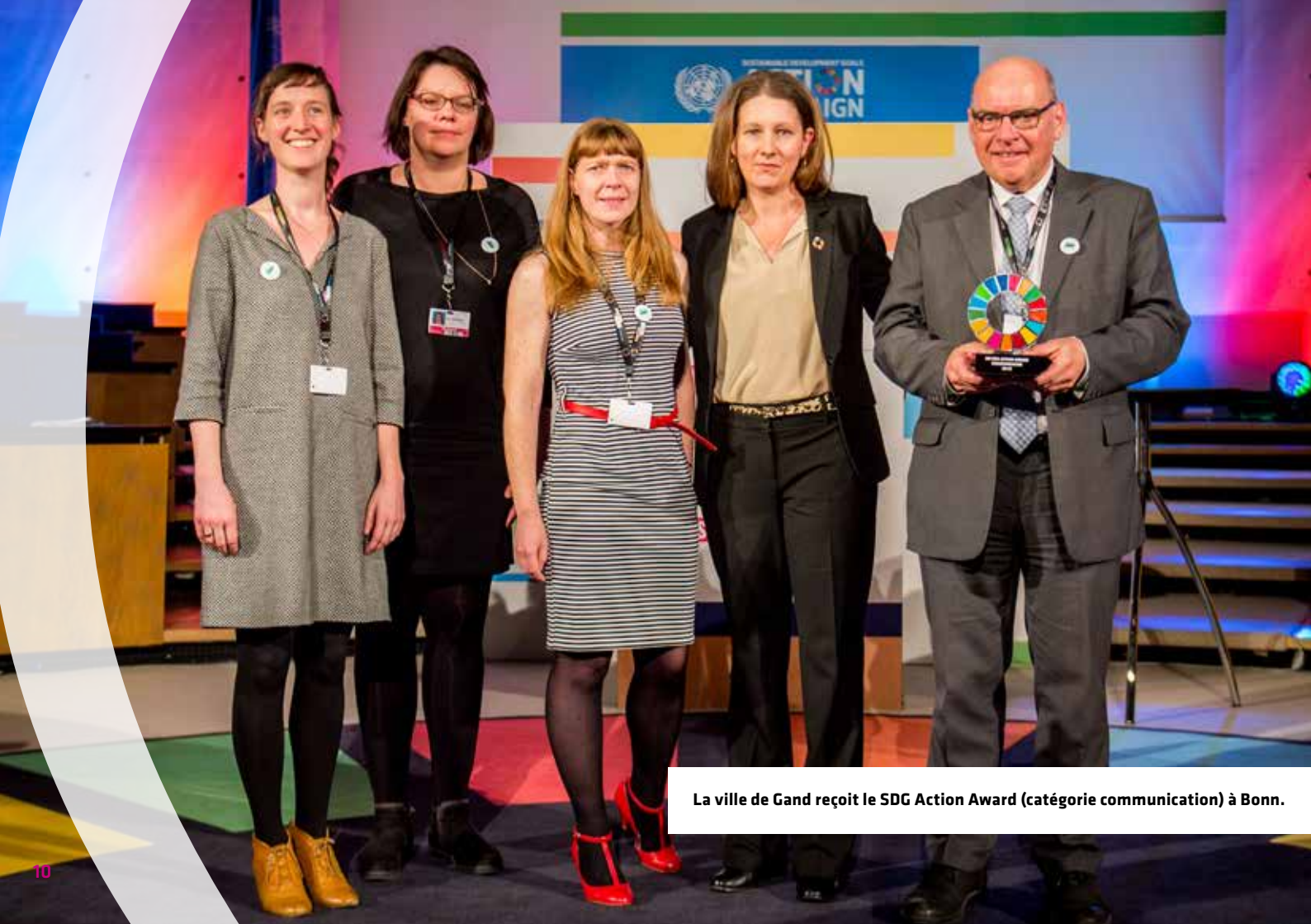
La ville de Gand reçoit le SDG Action Award (catégorie communication) à Bonn.