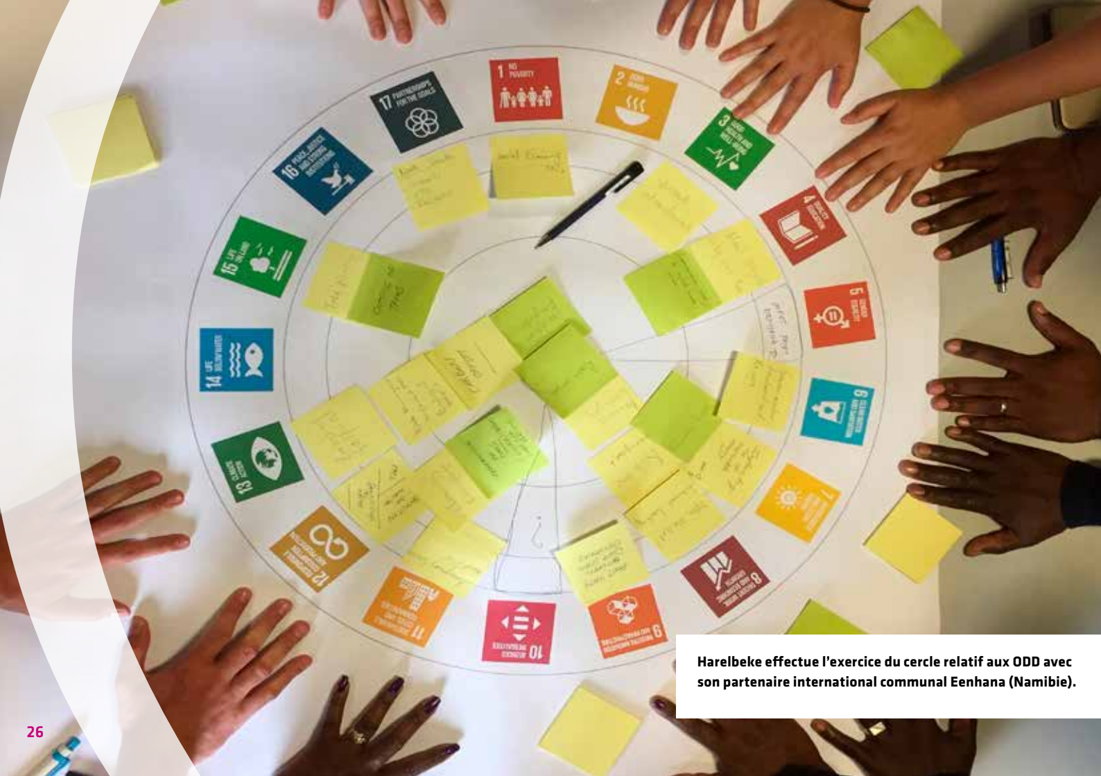
Harelbeke effectue l'exercice du cercle relatif aux ODD avec son partenaire international communal Eenhana (Namibie).