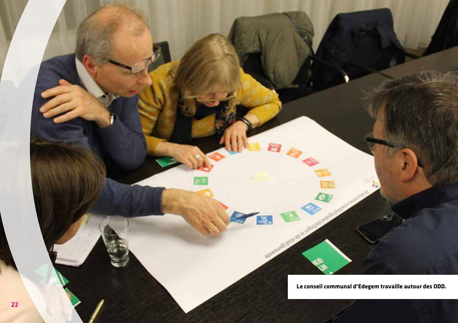
Le conseil communal d'Edegem travaille autour des ODD.