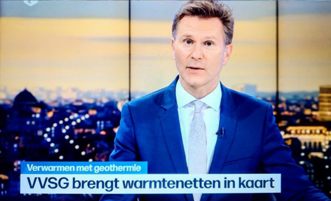
Verwarmen met geothermie VVSG brengt warmtenetten in kaart