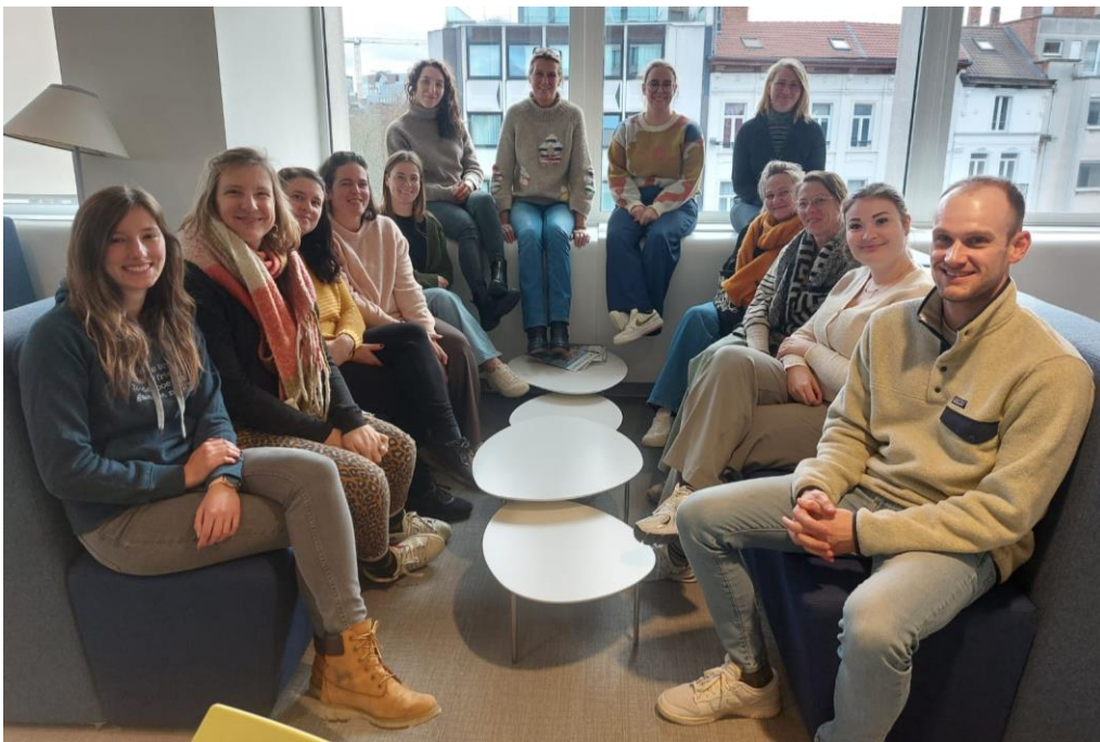
Deelnemers startersopleiding gezinszorg najaar 2024

Stuur je gegevens door naar netwerkhuiszorg@vvsq.be en ouderenzorg@vvsq.be .