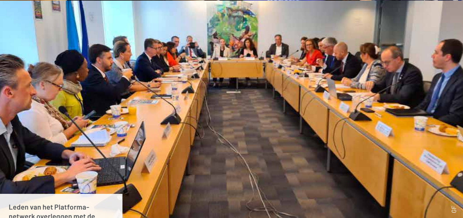
Leden van het Platforma-netwerk overleggen met de Europese vertegenwoordiging bij de Verenigde Naties.