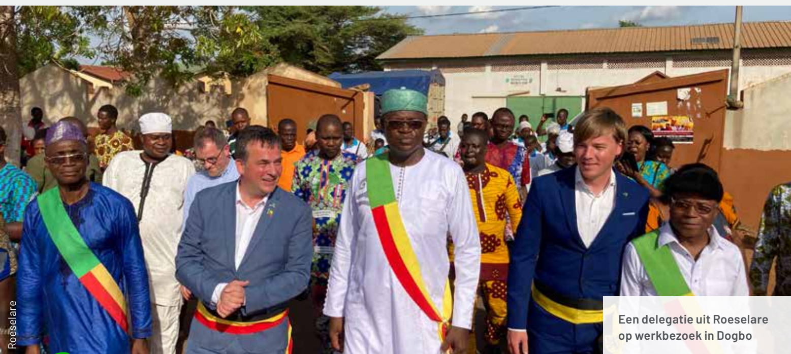
Een delegatie uit Roeselare op werkbezoek in Dogbo

Peer-to-peer uitwisseling tussen beide gemeenten versterkte de technische knowhow, maar ook het draagvlak voor de stedenband in Roeselare. Bovendien biedt de stedenband opportuniteiten op het gebied van wereldburgerschapseducatie en indirecte samenwerking. Zo wordt in samenwerking met de Belgische ngo Join for Water de link met Dogbo gelegd binnen een educatief project dat scholen in Roeselare op een duurzame manier wil laten omgaan met water. Ook gelinkt aan de stedenband ondersteunt de Roeselarese vzw D.O.G.B.O.-Dogbo een aantal sociale projecten en organiseert zij ervaringsreizen naar de Beninese partnergemeente.