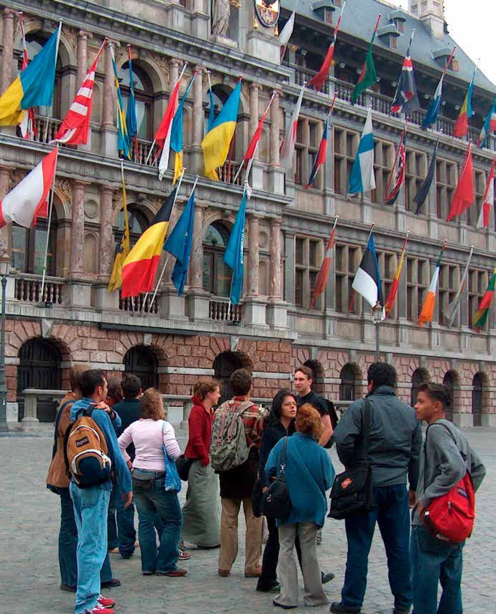
Nicajongeren uit Mol samen met de jongeren uit Santo Tomas op citytrip in Antwerpen.