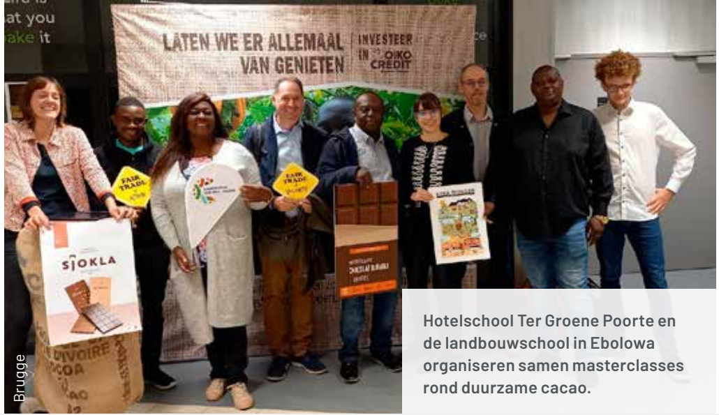
Hotelschool Ter Groene Poorte en de landbouwschool in Ebolowa organiseren samen masterclasses rond duurzame cacao.