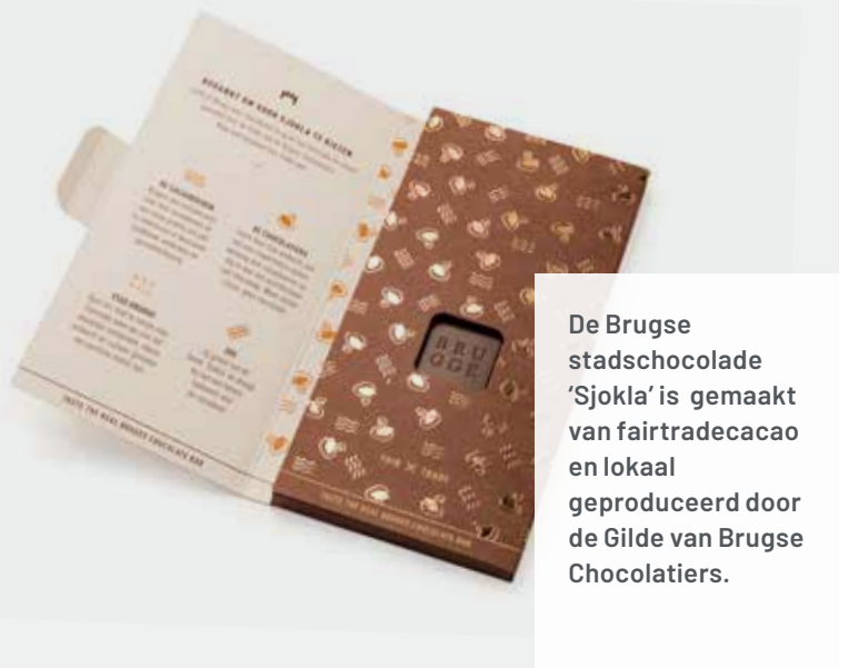
De Brugse stadschokolade 'Sjokla' is gemaakt van fairtradecacao en lokaal geproduceerd door de Gilde van Brugse Chocolatiers.

van de hogeschool Howest in kaart gebracht hoe de Bruggelingen en de Brugse chocoladesector tegenover duurzame chocolade staan. Op basis van deze info worden acties opgezet om duurzame cacao en chocolade op de kaart te zetten. Het project verloopt volgens een multi-stakeholdermodel waarbij lokaal samengewerkt wordt met de Brugse chocoladegilde voor de productie en verkoop van 'Sjokla' en met Oxfam en het chocolademuseum Choco-Story voor de sensibiliserende acties rond duurzame chocolade. Hotelschool Ter Groene Poorte en de landbouwschool in Ebolowa organiseren samen ook masterclasses rond duurzame cacao.