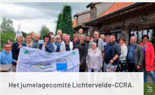
Het jumelagecomité Lichtervelde-CCRA.

Lichtervelde heeft sinds 2008 een jumelage met de Communauté de Communes de la Région d'Audruicq (CCRA) in het departement Pas-de-Calais in Frankrijk, dat 15 gemeenten omvat.