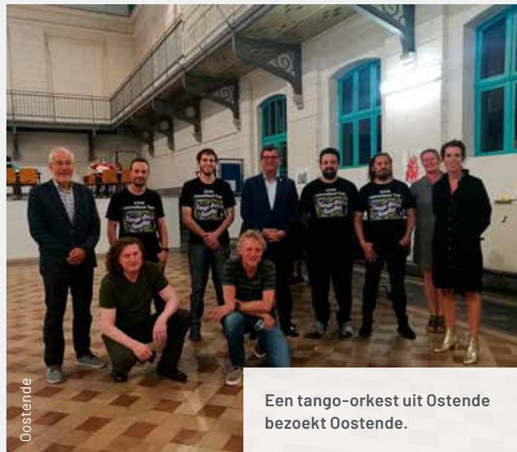
Een tango-orkest uit Ostende bezoekt Oostende.

Sinds 2021 heeft de stad Oostende een formele samenwerking met de stad Ostende die in 1909 in Argentinië door inwoners van Oostende werd opgericht. Via dit partnerschap willen beide steden niet alleen hun historische banden aanhalen, maar ook hun internationale uitstraling versterken, kennis uitwisselen en samenwerkingen opzetten. Voorbeelden van gezamenlijke activiteiten zijn de tentoonstelling België-Argentinië , inclusief tango- en culinaire-literaire avond in het Oostendse Mu. ZEE in 2022 en het Jazz en la Playa muziekfestival dat jaarlijks plaatsvindt in Ostende. In 2023 staat er eveneens een optreden van een Argentijns Tango Jazz kwartet in Oostende gepland.