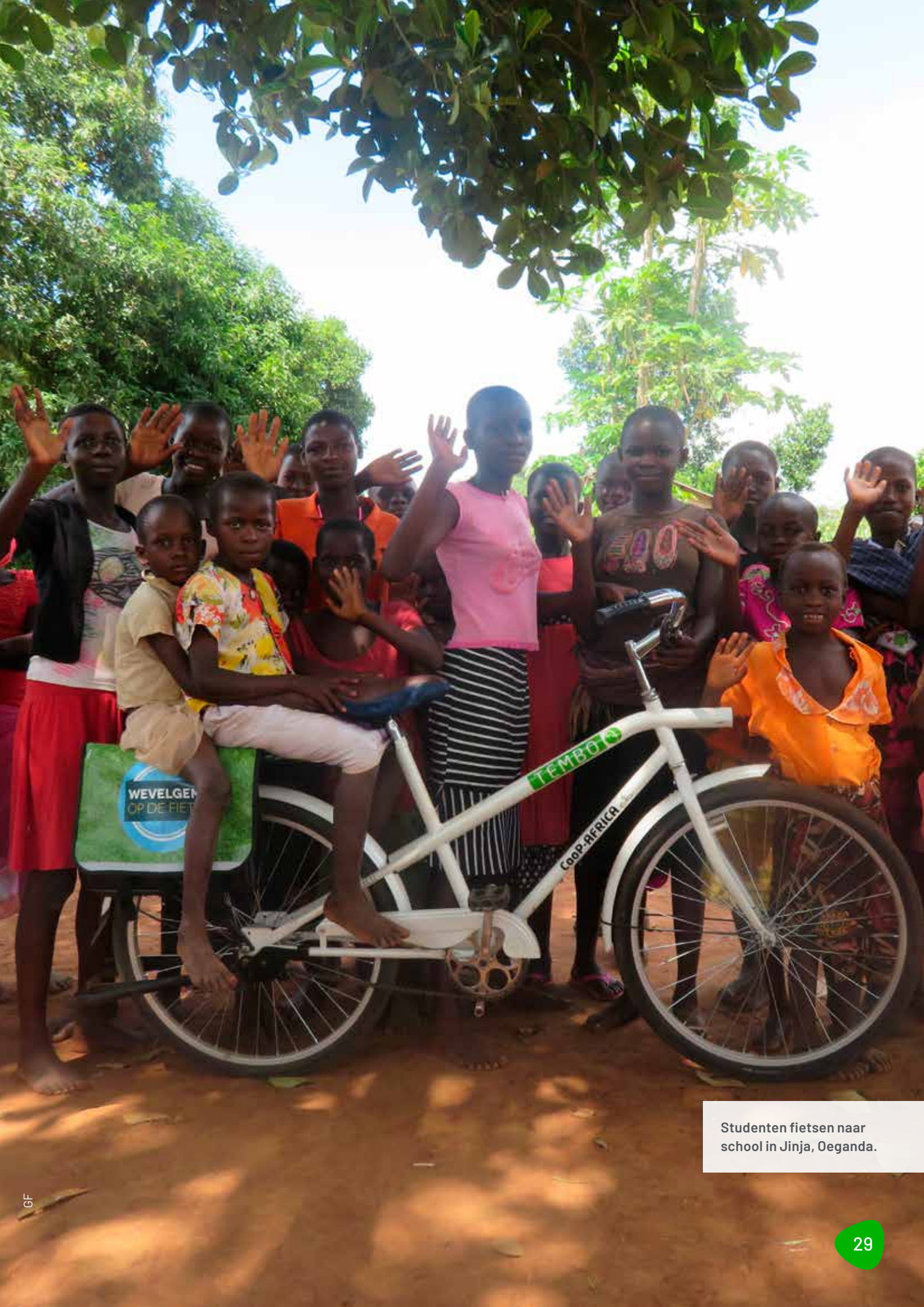
Studenten fietsen naar school in Jinja, Oeganda.