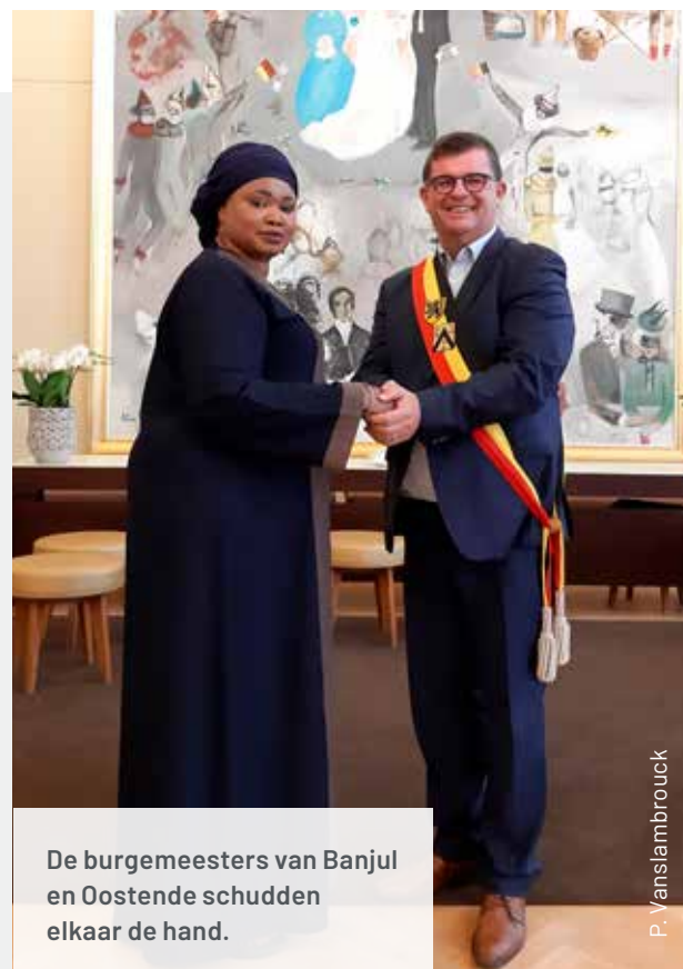
De burgemeesters van Banjul en Oostende schudden elkaar de hand.

De stedenband zit sterk verankerd binnen de twee lokale besturen en probeert zoveel mogelijk op een geïntegreerde manier en vanuit een multi-actorenbenadering naar de verschillende doelstellingen toe te werken.