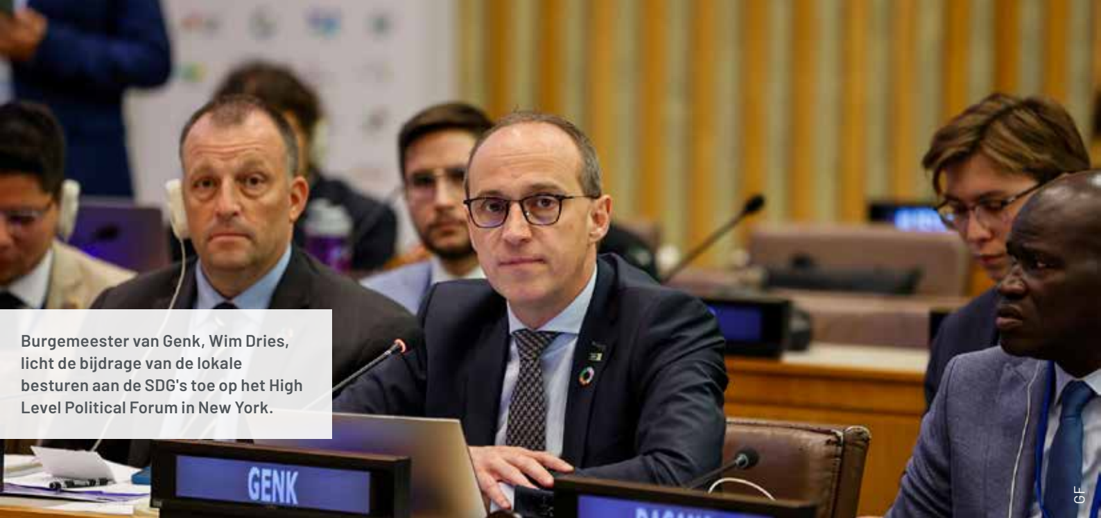
Burgemeester van Genk, Wim Dries, licht de bijdrage van de lokale besturen aan de SDG's toe op het High Level Political Forum in New York.