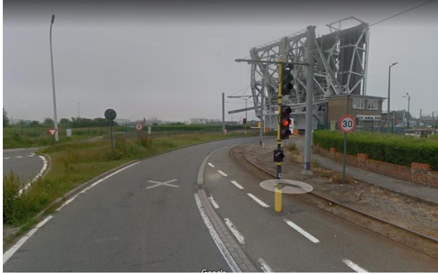
Één van de vele gevaarlijke verkeerssituaties in Zeebrugge.