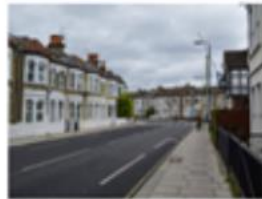
Klimaatdoelen worden verweven in stedenbouwkundige verordening