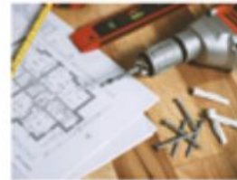
Leiedal, IGEMO en Stad Gent ondernemen actie in kader van Vlaamse renovatiegolf