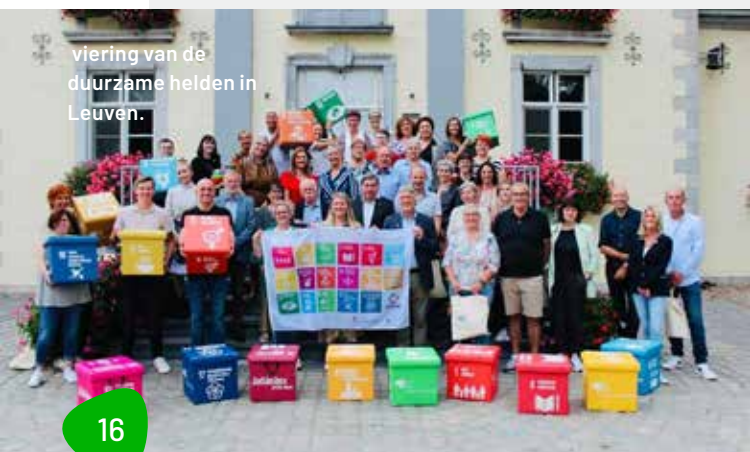
viering van de duurzame helden in Leuven.

het spel veel nieuwe inzichten gaf, vooral rond het aangaan van samenwerkingsverbanden om de SDG's lokaal te kunnen realiseren.