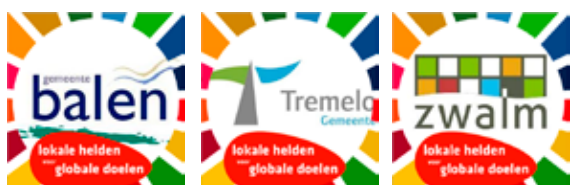
Facebookframe ontworpen door VVSG in 2020

Daarnaast voorzien we kant en klare communicatiematerialen die de gemeenten kunnen gebruiken om te communiceren over hun deelname aan de campagne en over hun duurzame helden, zoals digitale banners met het campagnebeeld, een facebookframe voor profielfoto's, een handleiding om een