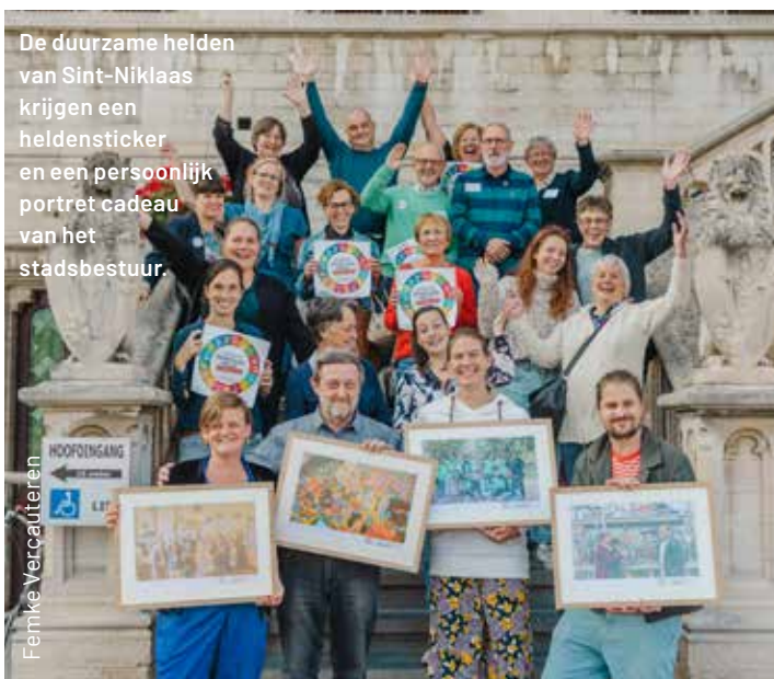
De duurzame helden van Sint-Niklaas krijgen een heldensticker en een persoonlijk portret cadeau van het stadsbestuur.

Vooraf de zoektocht naar duurzame helden en het communiceren met die helden vraagt een tijdsinvestering van de lokale campagneverantwoordelijke(n). In hoofdstuk 4 van de campagnehandleiding geven we tips om deze zoektocht aan te pakken. Uit een evaluatie-enquête van 2019 blijkt dat de grote meerderheid van de helden (65%) actief gevraagd werden door het lokaal bestuur. 18% gaf zich zelf op als duurzame held (na een open oproep) en 12% werd genomineerd door een medeburger.