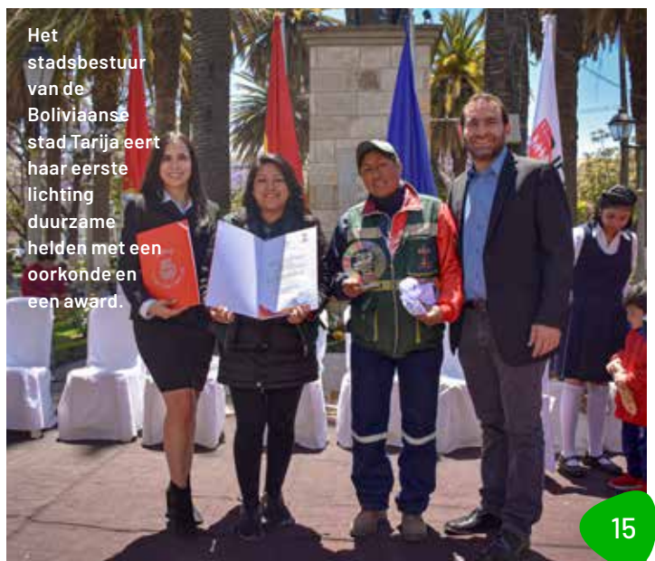
Het stadsbestuur van de Boliviaanse stad Tarija eert haar eerste lichting duurzame helden met een oorkonde en een award.