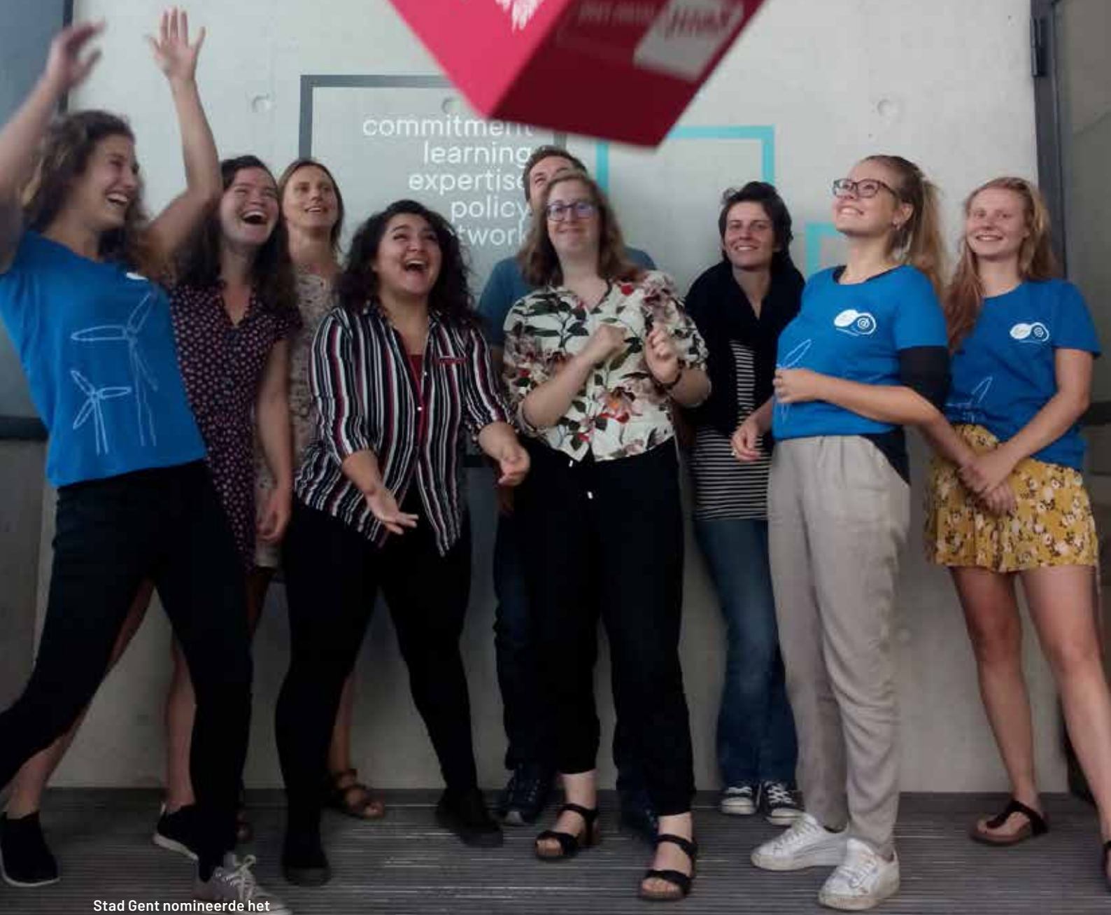
Stad Gent nomineerde het duurzaamheidskantoor van de UGent als één van haar duurzame helden.