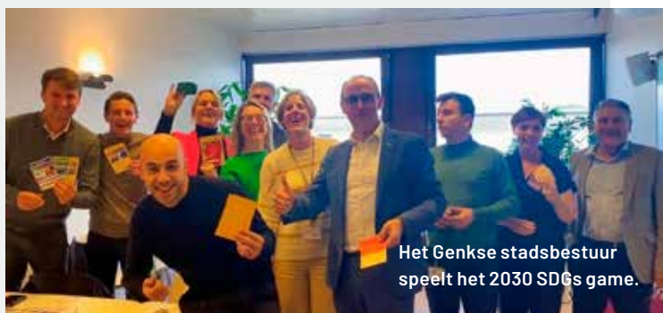
Het Genkse stadsbestuur speelt het 2030 SDGs game.