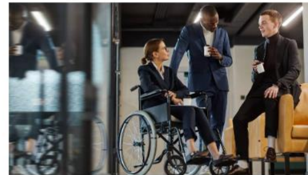
Ondernemen en werken