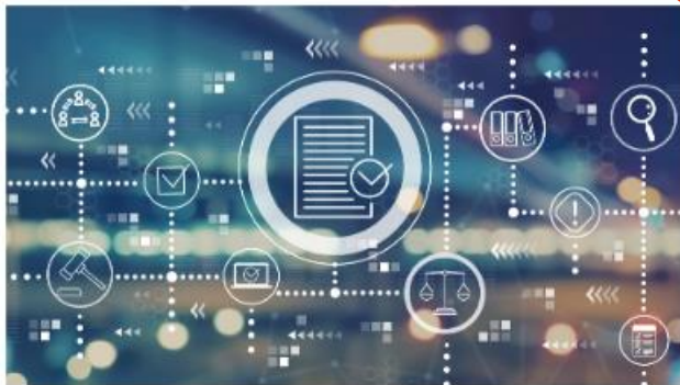
Algemeen bestuur, dienstverlening en communicatie