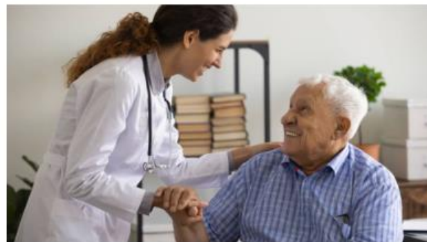
Welzijn en zorg