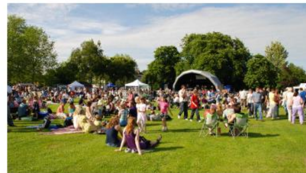
Sport en vrije tijd