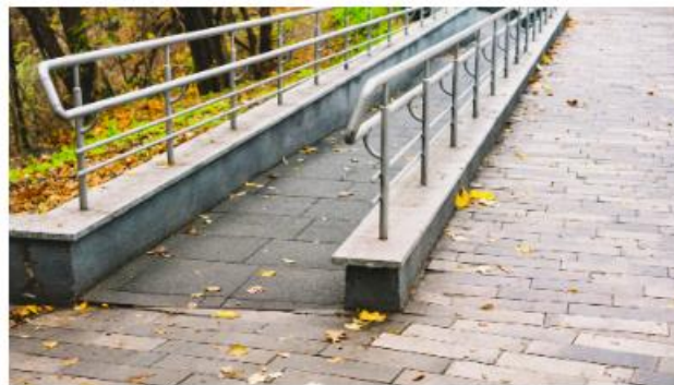
Ruimtelijke ordening en omgeving