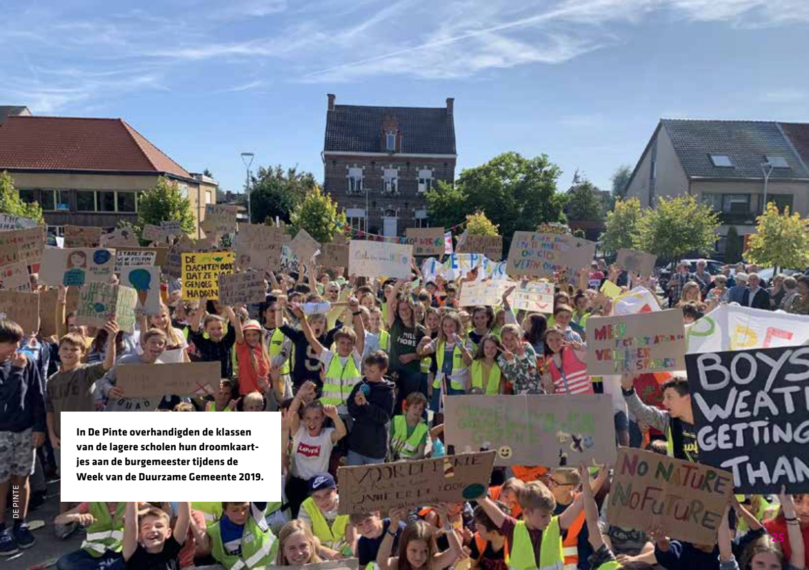
In De Pinte overhandigden de klassen van de lagere scholen hun droomkaarten aan de burgemeester tijdens de Week van de Duurzame Gemeente 2019.