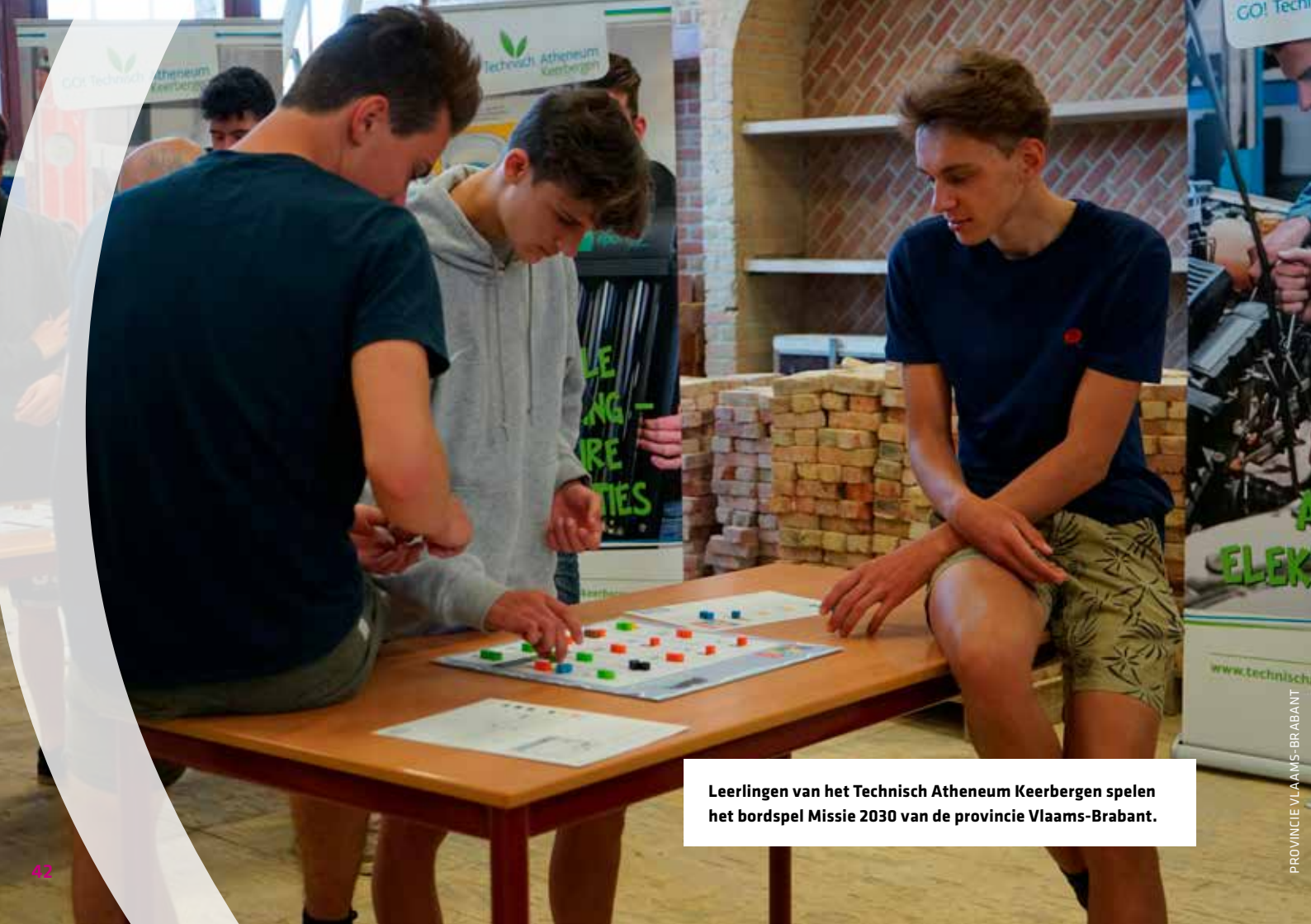
Leerlingen van het Technisch Atheneum Keerbergen spelen het bordspel Missie 2030 van de provincie Vlaams-Brabant.