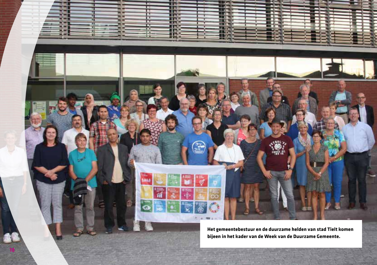
Het gemeentebestuur en de duurzame helden van stad Tiel komen bijeen in het kader van de Week van de Duurzame Gemeente.