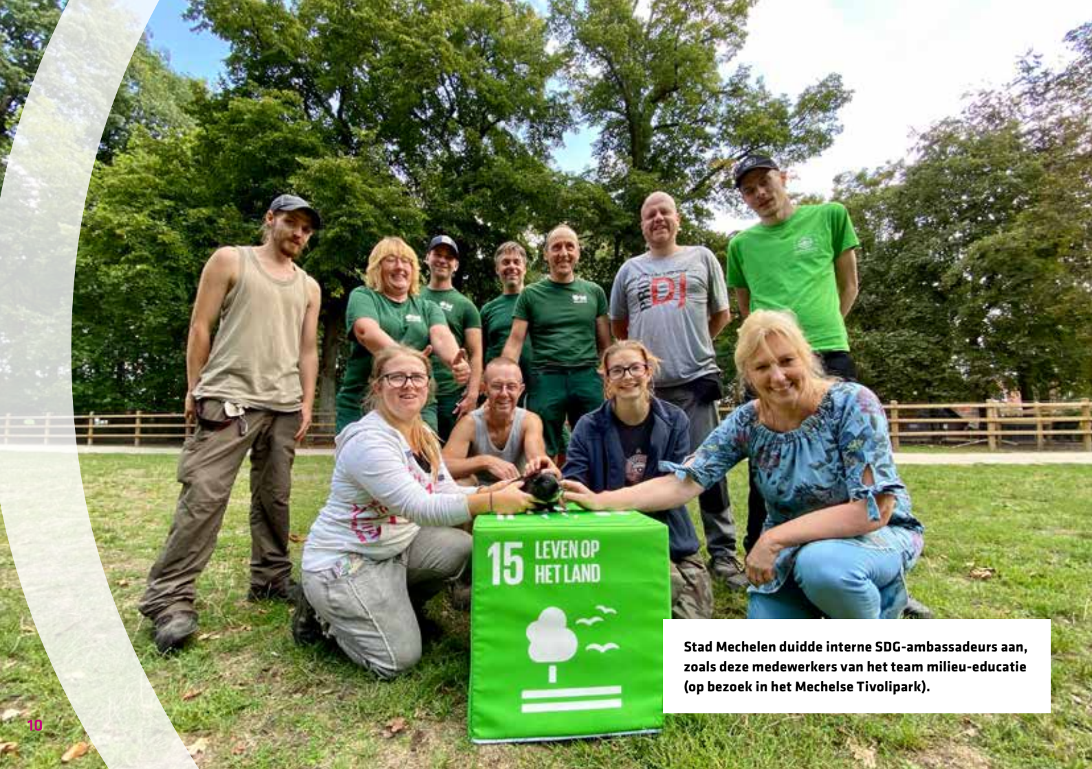
Stad Mechelen duidde interne SDG-ambassadeurs aan, zoals deze medewerkers van het team milieu-educatie (op bezoek in het Mechelse Tivolipark).