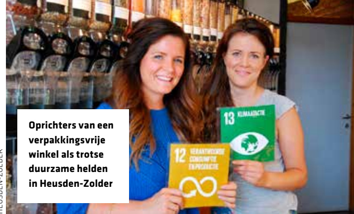
Oprichters van een verpakkingsvrije winkel als trotse duurzame helden in Heusden-Zolder